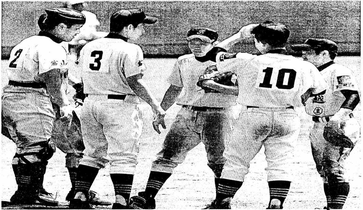
砺波工不二越工 8回裏砺波工の死二塁、勝ち越しされた直後、マウンドに集まり向坂(10)を励ます不二越工の内野陣(上野富山)